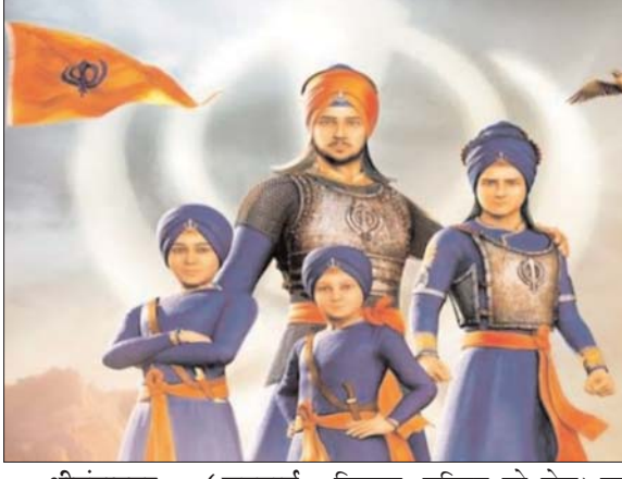
श्रीगंगानगर (जनमार्ग न्यूज)