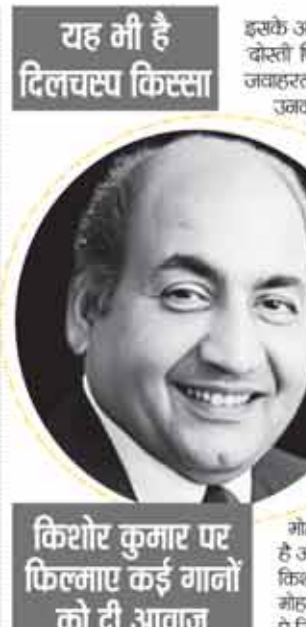
किशोर कुमार पर फिल्माए कई गानों को दी आवाज

नई दिल्ली। मोहम्मद रफ़ी की 24 को 100वीं जयंती मनाई गई। इस खास मौके पर हम उनके जीवन से जुड़ा दो खास किस्सा साझा कर रहे हैं। रफ़ी साहब से जुड़ी कई दिलचस्प कहानियां हैं, लेकिन भारत के पहले प्रधानमंत्री पंडित जवाहर लाल नेहरू से जुड़े दो किस्से ऐसे हैं, जिसे कम ही लोग जानते हैं। आपको जानकर हैरानी होगी कि साल 1948 में रफ़ी साहब का गाना इतना ज्यादा लोकप्रिय हुआ था कि इसे सुनने के लिए तत्कालीन प्रधानमंत्री ने रफ़ी साहब को अपने घर पर बुला लिया था। यह गाना 'सुनो सुनो ऐ दुनिया वालों बापूजी की अमर कहानी' था, जो बेहद लोकप्रिय हुआ।