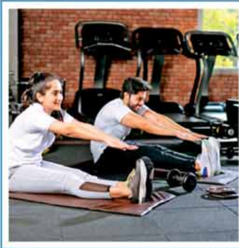
युवाओं के बीच पॉपुलर हैं।

सवाल है भारत में युवाओं के बीच आई इस फिटनेस अवेयरनेस का राज क्या है और किस तरह की फिटनेस को लेकर युवाओं में विशेष रूप से क्रेज या ट्रेंड देखा जा रहा है? 1980 और 1990 के दशक में फिटनेस के मुख्य साधन या जरिया ट्रेडिशनल एक्सरसाइज ही हुआ करती थीं, जिसमें दौड़ना, सार्कल चलाना और शारीरिक श्रम आधारित गतिविधियाँ थीं। लेकिन आज के इस तकनीकी युग में फिटनेस की गतिविधियाँ उतनी ही ट्रेडिशनल नहीं रह गई हैं। आज फिटनेस की गतिविधियों में कई तरह के फ्यूजन आ गए हैं। इनके लिए तकनीकी प्रगति और सोशल मीडिया के साथ-साथ युवाओं की बढ़ती इनकम का भी योगदान है। अब एक नजर इस पर भी डालते हैं कि किस-किस तरह के फिटनेस ट्रेन्ड, आज के