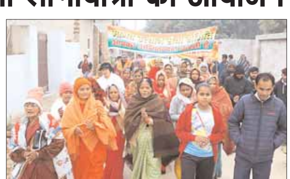
आयोजन हुआ। शोभायात्रा में एक राष्ट्र, एक ध्वज, एक आत्मा का संदेश दिया गया और आपसी भाईचारे व सद्भावना को बढ़ावा देने की अपील की गई। कार्यक्रम के समापन पर मानव उत्थान सेवा समिति की ओर से विशाल भंडारे का आयोजन किया गया। इस भंडारे में सैकड़ों श्रद्धालुओं ने प्रेम और सौहार्द के साथ प्रसाद ग्रहण किया। आयोजन का उद्देश्य