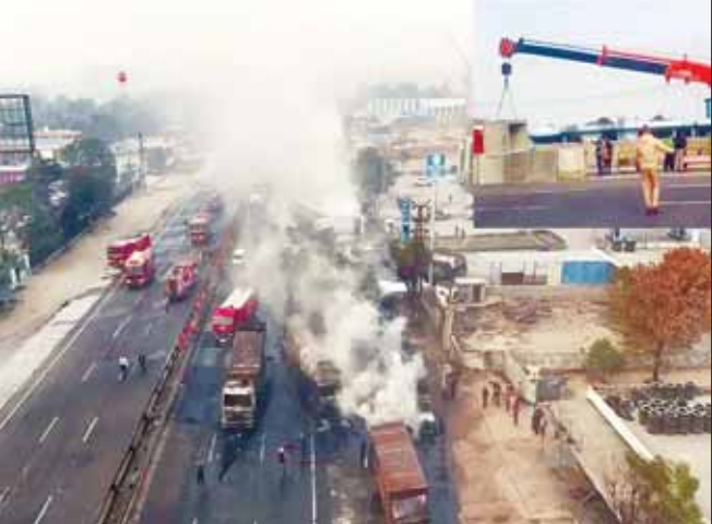
के जंक्शन पर बने फ्लाइटओवर के नीचे से ट्रैफिक को डायवर्ट किया गया

जनमार्ग न्यूज जयपुर। जयपुर-किशनगढ़ हाईवे पर 20 दिसंबर को हुए एलपीजी ब्लास्ट हादसे के करीब एक महीने बाद आज शनिवार सुबह नेशनल हाईवे ऑथोरिटी ऑफ इंडिया (एनएचआई) ने भांकरोटा के आगे बने कट (हादसे वाली जगह) को बंद करवा दिया है। वहीं, अजमेर और किशनगढ़ से आने वाला ट्रैफिक जो रिंग रोड दक्षिण पर जा रहा है, उसे करीब सेज 200 फीट रोड पर डायवर्ट किया है। एनएचआई अधिकारियों के मुताबिक हादसे वाली जगह से करीब 4 किलोमीटर पहले महिंद्रा सेज जाने वाले 200 फीट रोड