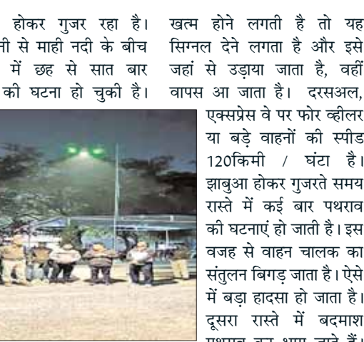
क्षेत्र से होकर गुजर रहा है। टिमरवानी से माही नदी के बीच सालभर में छह से सात बार पथराव की घटना हो चुकी है। खत्म होने लगती है तो यह सिग्नल देने लगता है और इसे जहाँ से उड़ाना जाता है, वहाँ वापस आ जाता है। दरसअल, एक्सप्रेस वे पर फोर व्हीलर या बड़े वाहनों की स्पीड 120किमी / घंटा है। झाबुआ होकर गुजरते समय रास्ते में कई बार पथराव की घटनाएं हो जाती हैं। इस वजह से वाहन चालक का संतुलन बिगड़ जाता है। ऐसे में बड़ा हादसा हो जाता है। दूसरा रास्ते में बदमाश पथराव कर भाग जाते हैं। ऐसे में ड्रोन 20 किमी की परिधि में बदमाश किस दिशा में भागे हैं, उनका पहनावा क्या था आदि के फोटो कैच कर लेगा। इससे पुलिस को उन्हें पकड़ने में सुविधा होगी। इसकी बैटरी भी 48 मिनट तक चलती है।

झाबुआ। यहाँ से होकर गुजरने वाले दिल्ली-मुंबई एक्सप्रेस वे (8इलेन) पर एक-दो दिन में दो ड्रोन से पेट्रोलिंग शुरू हो जाएगी। सूर्यास्त से सूर्योदय के बीच होने वाली पेट्रोलिंग में एक बार में ड्रोन दो किमी ऊंचाई पर उड़ाएँगे जो 20 किमी तक जाएगा। इसमें 48 मेगा पिक्सल का कैमरा है जिससे 8 लेन पर कोई संदिग्ध स्थिति या पथराव करने वाले उत्पाती बदमाश खड़े हो तो आसानी से पिकर कैप्चर हो जाएगी। ऐसे संस्तर लगे हैं कि 20 किमी की परिधि में कोई पेड़ या तार बीच में आ जाए तो यह दो फीट पहले रुक जाएगा। दरसअल, एक्सप्रेस वे झाबुआ जिले की 30 किमी के