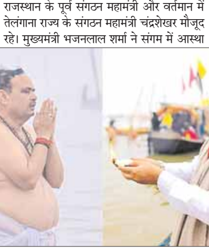
की डुबकी लगाने के बाद सोशल मीडिया पर पोस्ट कर लिखा : प्रयागराज में आस्था, श्रद्धा और एकता के महासमामग 'महाकुंभ-2025' में

जयपुर (जनमार्ग न्यूज)। उत्तरप्रदेश के प्रयागराज में 144 साल बाद आयोजित महाकुंभ में श्रद्धालुओं का तांता लगा हुआ है। देश-दुनिया से श्रद्धालु संगम नगरी में आस्था की डुबकी लगाने के लिए पहुंच रहे हैं। इसी कड़ी में राजस्थान के मुख्यमंत्री भजनलाल शर्मा शनिवार को प्रयागराज पहुंचे। जहां उन्होंने आज संगम घाट पहुंचकर पवित्र स्नान किया। साथ ही सीएम ने लेते हुए हनुमान जी महाराज के दर्शन कर विधि-विधान से पूजा की। इसके बाद सीएम प्रदेश के मंडपम का जायजा एवं संतो का सम्मान भी करेंगे। इससे पहले सीएम भजनलाल ने शनिवार की देर रात राजस्थान पैवेलियन का निरीक्षण किया। श्रद्धालुओं के लिए बनाए गए पंडालों और प्रचार-प्रसार से जुड़ी सामग्री फोटो और रोचक ऑडियो-विडियो सामग्री को देखा। साथ ही श्रद्धालुओं के ठहरने की शानदार व्यवस्थाओं पर प्रसन्नता जताई। इस दौरान