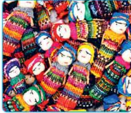
ग्वाटेमाला की वरी डॉल्स

घिरा रहता है, तो वरी डॉल उसे राहत पहुंचाती है। ग्वाटेमाला की यह गुड़िया, घर में उपलब्ध सामग्रियों से बनाई जा सकती है। इसे अकसर रद्दी कपड़ों, पतली छड़ियों, सौंकर, तार, धागे आदि को सहायता से बनाया जाता है। इसे बनाने का कोई