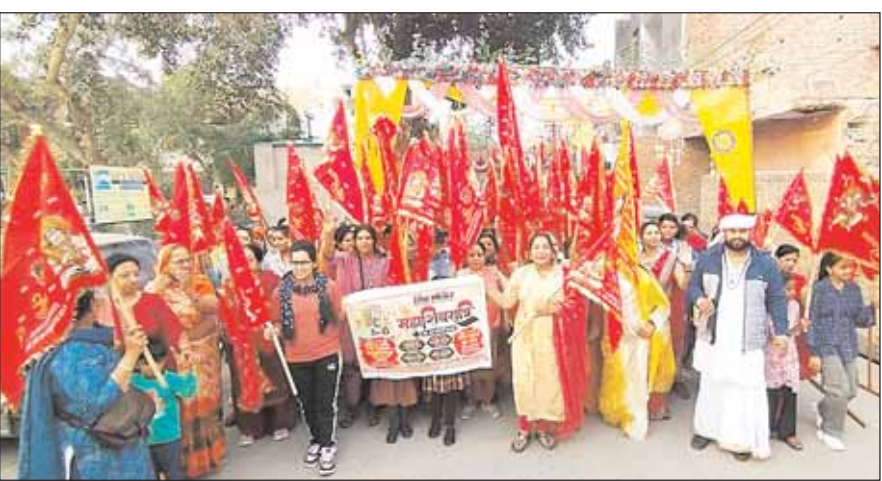
अखंड नमः शिवाय पंचाक्षरी मंत्र जाप की पूर्णाहुति जनमार्ग न्यूज

श्रीगंगानगर। विनोबा बस्ती पार्क में स्थित शिव मंदिर में महाशिवरात्रि पर्व के उपलक्ष्य में मंगलवार दोपहर मन्दिर प्रांगण से ध्वजा यात्रा निकाली गई, जोकि गांधी नगर, एच ब्लॉक, पी ब्लॉक से होते हुए वापिस शिव मंदिर में पहुंची। इससे पहले मंगलवार को आरंभ हुए 27 घंटे के अखंड नमः शिवाय