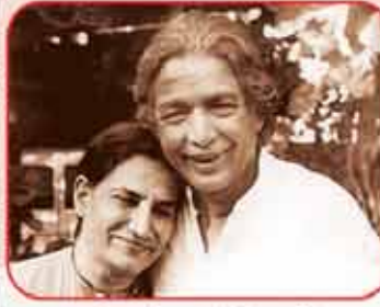
शौकत के साथ कैफ़ी आजमी

कैफ़ी आजमी-शौकत: बीस दिन गुजर चुके थे और शायर कैफ़ी आजमी को अपनी प्रेमिका शौकत (बाद में पत्नी) की कोई खबर नहीं मिली थी। उन्हें लगा कि शौकत उनसे किसी बात पर नाराज हो गई हैं। उन्हें मनाने के लिए रात में 1 बजे कैफ़ी ने अपने खून से एक प्रेम पत्र लिखा, 'तुम्हें लिखने के बाद मैंने लिफाफे को खोल दिया और बिस्तर में चला गया यह सोचते हुए कि कुछ नींद आ जाएगी, लेकिन नींद नहीं आई। मैंने तुम्हारे पिछले खत को फिर पढ़ा और अपने आंसू रोके न सका। शौकत, ये मेरी बदकिस्मती है कि तुम्हें मुझ पर या मेरे प्यार पर यकीन नहीं है। कुछ दिन से मैं कुछ नहीं सोच रहा हूँ, सिवाय इसके कि तुम्हें किस तरह से यकीन दिलाने