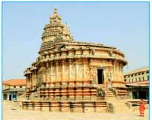
श्रंगेरी मठ के परिसर में स्थित मां शारदाबा का भव्य मंदिर

मठ के वर्तमान आचार्य पूज्य भारतीय तीर्थ, रात्रि के समय स्वयं अपने निवास के समीप बने एक विशाल प्रांगण में भगवान चंद्र मौलीश्वर की पूजा करते हैं। सैकड़ों भक्तों की उपस्थिति में दर्जनों विद्वान् ब्राह्मणों द्वारा समवेत स्वर में ऋग्वेद, यजुर्वेद और सामवेद के मंत्रों के साथ भगवान शिव की पूजा की जाती है। इन पवित्र धार्मिक स्थलों के दर्शन अपने आप में अलौकिक अनुभव कराते हैं।