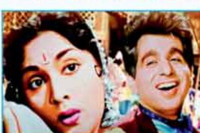
'नया दौर' के गीतों को सुरों में सजाया ओ.पी. नैय्यर ने

गीत नहीं गवाने के अपने प्रण पर ताउम्र अटल रहे, वहीं दूसरी तरफ उन्होंने लता की ही बहन आशा भोसले को आवाज में सैकड़ों सदाबहार गीत रिकॉर्ड कराए। आशा भोसले के साथ ओ.पी. नैय्यर ने लंबे समय तक काम किया और कई यादगार गाने रचे। उस समय तक अपनी बड़ी बहन लता के साथ में रह रहे आशा को नैय्यर ने यह विश्वास दिलाया कि संगीत की दुनिया में अपना अलग रास्ता, अलग मुकाम वह स्वयं बना