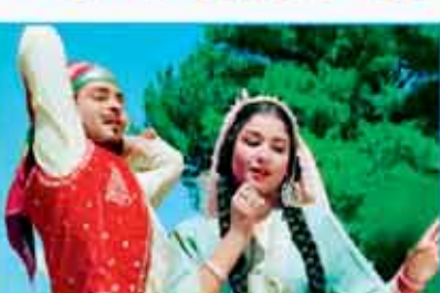
फिल्म 'कश्मीर की कली' में नैय्यर ने रची यादगार धुनें