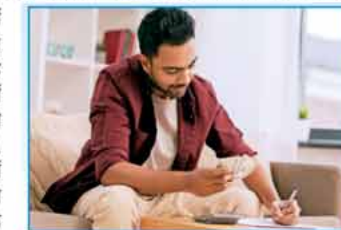
क्या होता है?

श्रंगेरी कर्नाटक राज्य के मंगलूर से 108 और उडुपी से 90 किलोमीटर की दूरी पर स्थित है। यहां अनेक रिजोर्ट होटल के अतिरिक्त मठ की ओर से कम शुल्क में ठहरने और भोजन की सुविधा उपलब्ध है। यूं तो यहां वरुण के लिए वर्ष में कभी भी आया जा सकता है, लेकिन सर्दी के अलावा गर्मी से पूजा का वास्तविक भोजन यहां आने के लिए सबसे अनुकूल होता है।