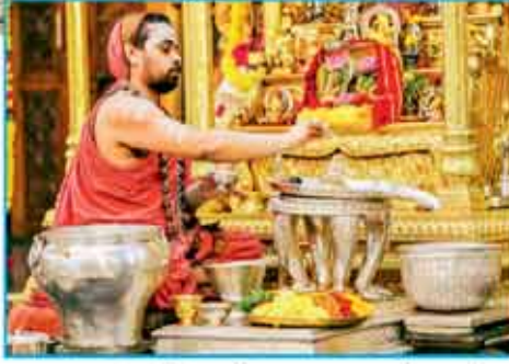
भगवान चंद्र मौलीश्वर की पूजा-आराधना करते आचार्य

शारदाबा मंदिर के बाहर, बारहवीं सदी में बने विद्याशंकर मंदिर की शिल्पकला वैज्ञानिक सिद्धांतों पर आधारित है और देखने में अनुपम है। यह मंदिर विजयनगर साम्राज्य के यशस्वी राजा हरिहर-बुक्का द्वारा बारहवीं सदी में बनवाया गया था। यह मंदिर स्थाना संरचना पर बना है। ऐसे मान्यता है कि रथ के चारों पहिए धरती के अंदर स्थित हैं। भगवान शिव को समर्पित इस मंदिर की विशेषता यह है कि इसमें बने बारह स्तंभ, बारह राशियों का प्रतिनिधित्व करते हैं। प्रत्येक संक्रांति पर सूर्य जिस राशि में प्रवेश करता है, उस राशि के स्तंभ पर सूर्य की किरण क्रमानुसार पड़ती है। मंदिर के चारों ओर की दीवारों पर पौराणिक कथाओं को दर्शाती