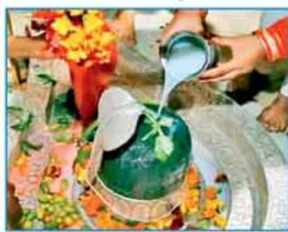
महत्व खासतौर से बताया गया है। साथ ही बताया गया है कि बिना बिल्वपत्र के शिवपूजा अधुरी होती है। वहीं, आर शिवजी की पूजा के लिए कई तरह की चीजें उपलब्ध न भी हों और सिर्फ एक बिल्वपत्र चढ़ा दिया जाए तो उससे पूजा का पूरा फल मिलता है। पौराणिक मान्यताओं के मुताबिक जब देवी पार्वती ने भगवान शिव को पति रूप में पाने के लिए तपस्या और पूजा की थी तब सबसे पहले उन्होंने ही भगवान शिव को बिल्वपत्र चढ़ाया था। महाशिवरात्रि की महिमा: शिव आराधना की दृष्टि से महाशिवरात्रि की विशेष महत्ता है। जब सर्वव्यापक, सर्वसमर्थ, सर्वज्ञानी, सर्वशक्तिमान, अच्युत, अखंड, रसप्रद, सुखरूप, आनंदस्वरूप, विपत्तिभंजक, अघनाशक, दुःखहर्ता, सुखकर्ता, मंगलमूर्त, कर्णानिधान, पतितप्रायन भगवान शिव (आशुतोष) की पूर्ण समर्पण से भक्ति की जाती है, तो वे जल्द (आशु) ही प्रसन्न (तुष्ट) हो जाते हैं। तो आइए, इस महाशिवरात्रि, उस शिव का स्मरण करें, अपने अंदर के शिवत्व का जागरण करें। ३० नमः शिवाय। *

अनन्य भक्त रावण द्वारा बनाया गया था। सर्प उनकी देह से लिपटे रहते हैं। त्रिशूल उनका अस्त्र है। यह त्रिशूल त्रयी का प्रतीक है। नृत्य करते समय वह डमरू धरते हैं। उनके डमरू का नाद इस ब्रह्मांड की ऊर्जा के कंपन को प्रतिध्वनित करता है। नटराज शिव इस सृष्टि के कण-कण में समाए हुए हैं। पूजन में बिल्वपत्र की महत्ता: बिल्व वृक्ष को शिव जी का ही एक स्वरूप माना गया है। इसका एक नाम श्रीवृक्ष भी है। श्री महालक्ष्मी का एक नाम है। इस वृक्ष को जड़ों में देवी गिरिजा, तने में देवी महेश्वरी, शाखाओं में देवी दशायनी, पत्तियों में देवी पार्वती, फूलों में मां गौरी और फलों में देवी काल्यायनी वास करती हैं। पत्तियों में देवी पार्वती का वास होने से शिवलिंग पर इसे खासतौर पर चढ़ाया जाता है। शिवमहापुराण में इसका