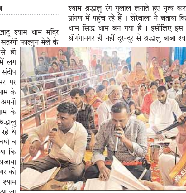
नारियल चढ़कर अपनी-अपनी मन्त्रें बाबा से मांग रहे हैं। रात्रि हुए जागरण में भजन प्रवाहकों ने अपने भजनों की ऐसी तान छोड़ी की प्रत्येक श्रद्धालु मदमस्त हो गया। उनकी आंखों से इन भावपूर्ण भजनों को सुनकर अश्रुधारा बह उठी। मंदिर प्रांगण बाबा श्याम की जयकारों से गूंज उठा। पकौड़े और