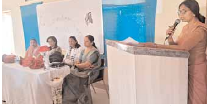
महिला दिवस के उपलक्ष में महिला सम्मान कार्यक्रम का आयोजन

रामायण के प्रसंगों के माध्यम से महिलाओं की भूमिका व अस्तित्व पर व्याख्यान किया उन्होंने कहा कि पुरुष प्रधान समाज में महिला प्रत्येक काम की भागीदार होने के बावजूद खुद को कमजोर और पिछड़ा मानती है जबकि भारतीय संस्कृति में देवी की आराधना के बिना कोई