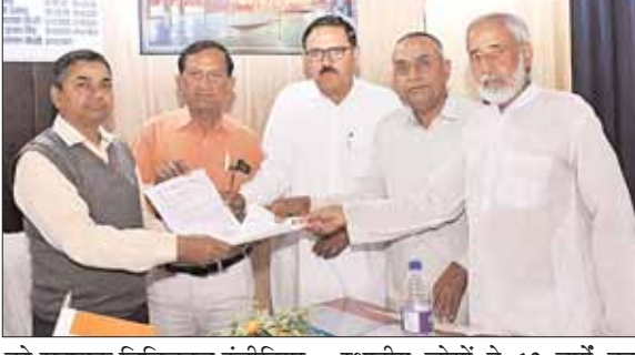
को सहायक डिविजनल इंजीनियर और स्टेशन अधीक्षक को ज्ञापन सौंपा। ज्ञापन में गांधी नगर से मुख्य बाजार तक निर्माणधीन रेलवे फुट ओवर ब्रिज को शीघ्र पूरा कराने की मांग की गई।

वर्ष पूर्व 3.75 करोड़ रुपये रेलवे के खाते में जमा करवाए थे। इसके बावजूद, अभी तक ब्रिज का कार्य अधूरा पड़ा है। वर्तमान में 70 प्रतिशत निर्माण कार्य पूरा हो चुका है और गार्डर पिलर आदि तैयार हैं, लेकिन कार्य लंबे समय से ठप पड़ा है। स्थानीय निवासियों ने बताया कि वे सैकड़ों बार रेलवे अधिकारियों को ज्ञापन सौंप चुके हैं, लेकिन समस्या का समाधान नहीं हो रहा। निर्माण कार्य के ठेकेदार का कहना है कि उसे भुगतान नहीं मिल रहा है, जिसके कारण कार्य आगे नहीं बढ़ पा रहा। इस देरी से गांधी नगर की करीब 30,000 की आबादी को भारी परेशानी उठानी पड़ रही है। खासतौर पर वृद्ध, महिलाएं, बीमार व्यक्ति और स्कूल की छात्राएं जान जोखिम में डालकर रेलवे लाइनों को पार करने को मजबूर हैं।