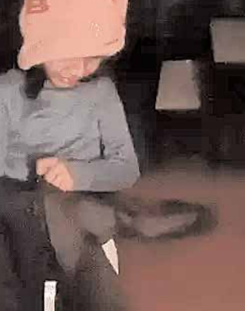
उन्होंने हंगामा करते हुए

गुरुग्राम। गुरुग्राम में सदर बाजार स्थित राजकीय कन्या प्रार्थमिक स्कूल में प्राइमरी क्लास की एक बच्ची को कमरे में बंद करके टीचर घर चले गए। बच्ची क्लास में ही सो गई थी और टीचरों ने बिना देखे ही कमरे में ताला लगा दिया। बच्ची को घर ले जाने वाला रिक्शा ड्राइवर जब स्कूल पहुंचा तो उसे बच्ची नहीं मिली। ढूँढते हुए वह स्कूल के अंदर गया तो क्लास रूम से रोने की आवाज सुनाई दी। रिक्शा चालक दौड़कर उस कमरे के पास गया। उसने स्कूल के बाहर दुकान करने वाले आशु को मामले की जानकारी दी। इसके बाद आसपास के लोगों की मदद से ताला तोड़कर बच्ची को बाहर निकाला गया। घटना 1 मार्च की है, लेकिन अब इसका वीडियो सामने आया है।