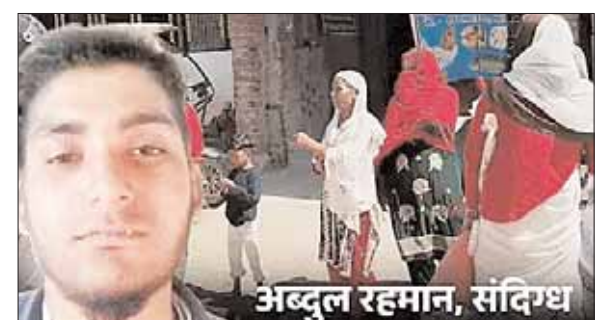
अयोध्या (जनमार्ग न्यूज)

2 हैंड ग्रेनेड मिले, मिल्कीपुर के घर में सर्च ऑपरेशन; मां बोली- जमात में गया था