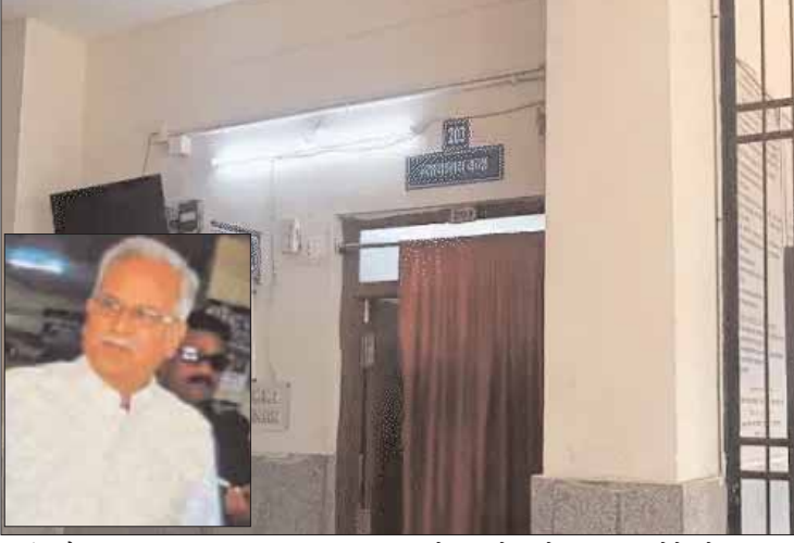
कांड केस ?